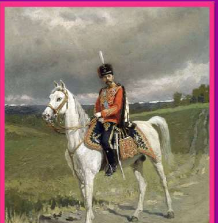
Картина Маковского А. В. "Император Николай II"