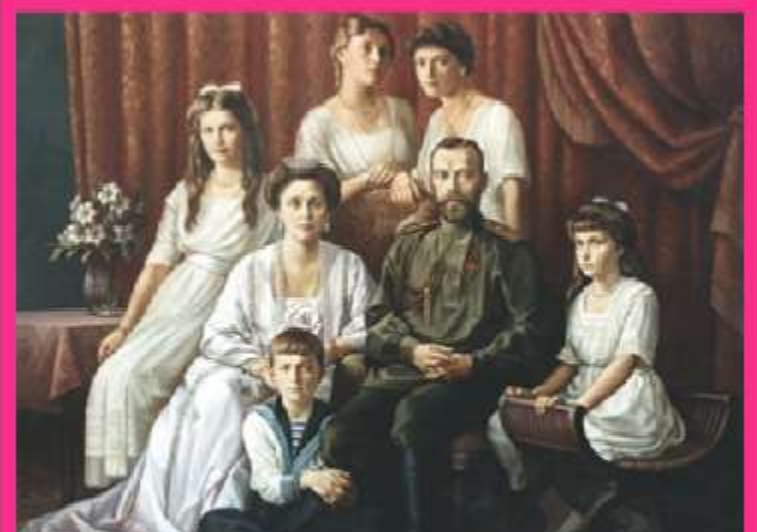
Семья Императора Николая II

В июле 1918 года уральским советом рабочих депутатов было принято решение о расстреле Николая Романова и всех членов его семьи. В ночь на 17 июля приговор привели в исполнение: Николай II, Александра Федоровна, дочери Ольга, Татьяна, Мария, Анастасия, а также доктор семьи Боткин и прислуга были расстреляны в подвале дома.