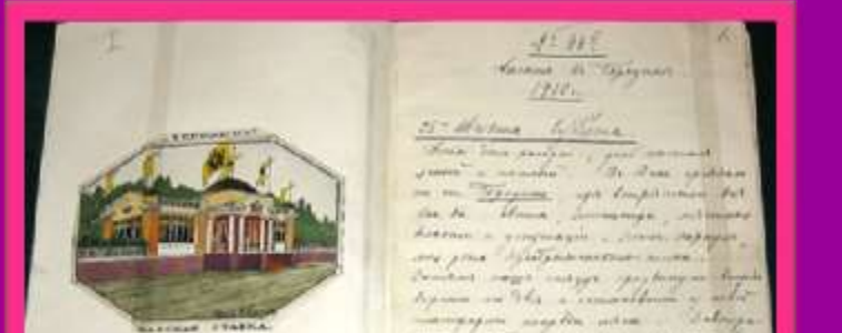
Дневник императора Николая II за 1912 – 1913 годы