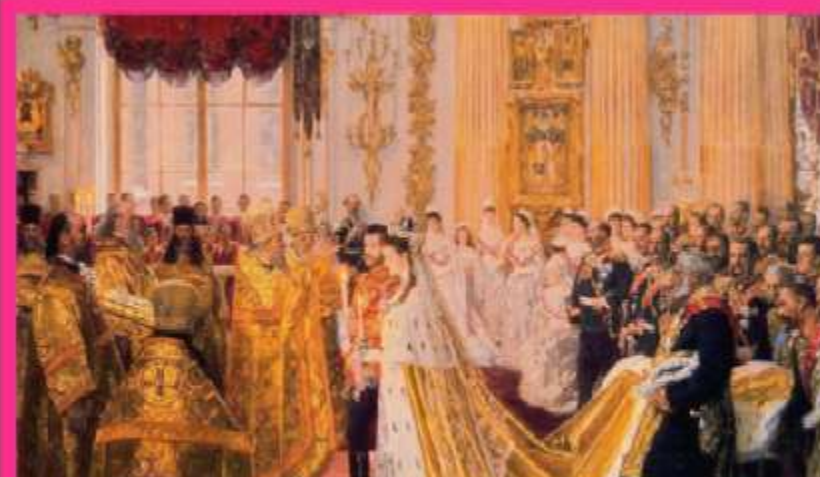
Венчание Цесаревича Николая и принцессы Алисы Гессен-Дармштадтской