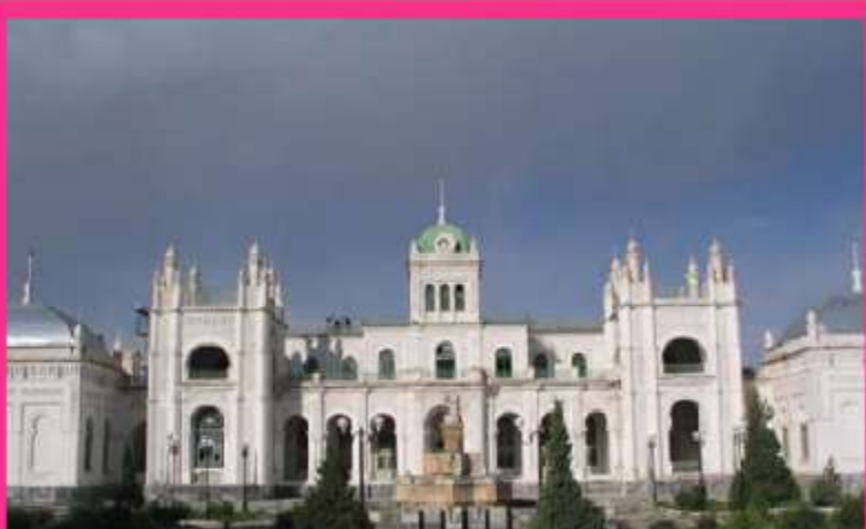
Дворец Императора Николая II в Кагане