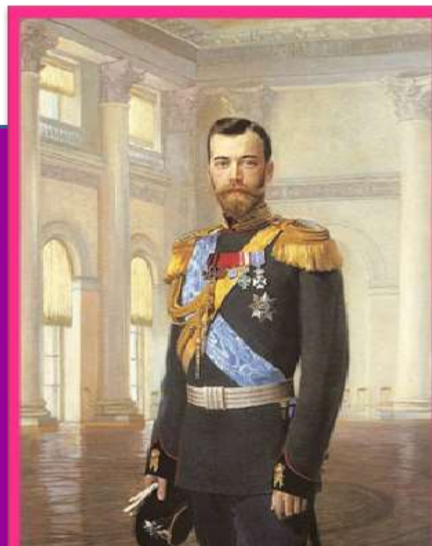
14-й Император Всероссийский Николай II

Вместе с тем Николай II по сути и убеждениям был далек от новаторства и не принимал необходимость давно назревших реформ, оставаясь противником конституции. Он обладал острым умом, почти исключительным самообладанием и выдержкой, был, по отзывам современников, не только чутким, но и необыкновенно добрым человеком. Вместе с тем управление огромным государством явно его тяготило: спокойная семейная жизнь были ему гораздо ближе, чем утомительные и связанные с высокой ответственностью обязанности императора. Современники отмечают также и необыкновенное упрямство Николая II.