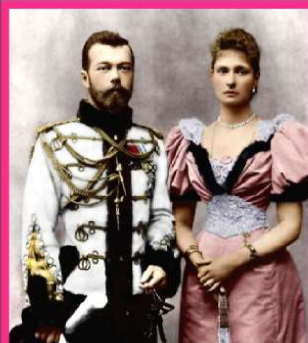
Император Николай II и императрица Александра Фёдоровна. 1896 г