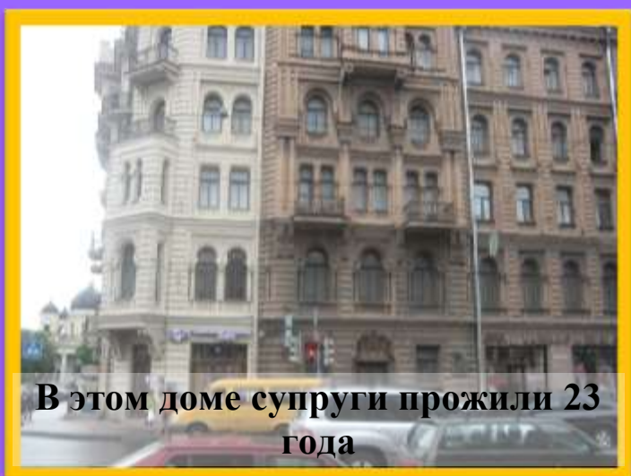
В этом доме супруги прожили 23 года